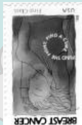
"Fund the Fight. Find a Cure."

Este boffin de noticias se hace posible con una conecson de las Fundación de S. Mark Taper de Los Angeles, California